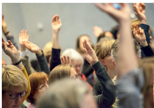
Eindrücke von der bagfa-Jahrestagung in Augsburg